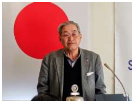
「ロータリー職業奉仕について」