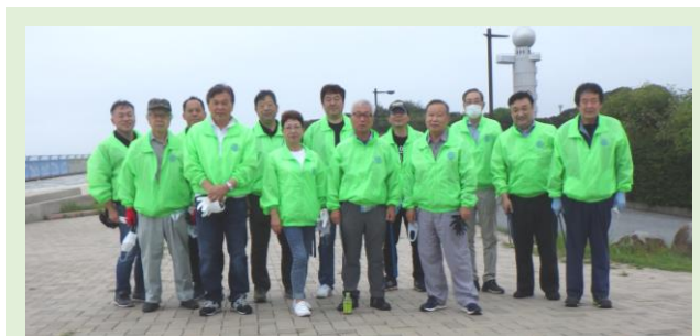
9/12 環境保全プロジェクト時 袖ヶ浦ロータリークラブのジャンパー着用の様子

1960年代からは高度成長期に入り1970年代になると日本の人口が1億人になり「一億総中流」と国民の大多数が自分を中流階級だと意識したそうです。その当時は、大衆車のトヨタカローラ、日産サニーが発売になりかなり売れてマイカー時代が到来しました。家電も身近に使う商品がかなり売れて景気が良かったです。私自身もそのサラリーマン時代は営業と生活に恩恵を受けました。あれから50年経ちますが今はどうでしょう。所得格差が大きく広がりましたね。富裕層はますます豊かになっていますが、困っている家庭も数多くあるようです。困っているところには手を差し伸べましょう。