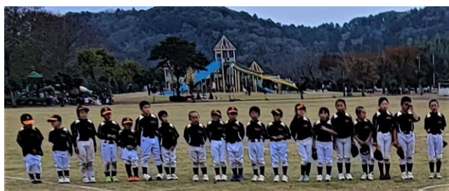
準優勝 神納フレンズ