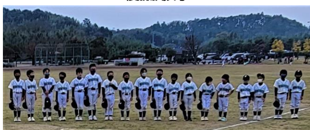
優勝 若草ファイターズ