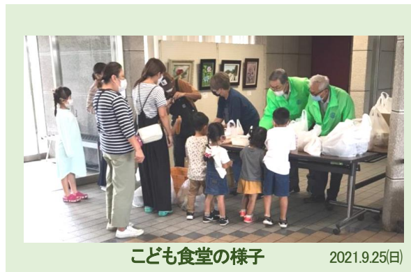
こども食堂の様子